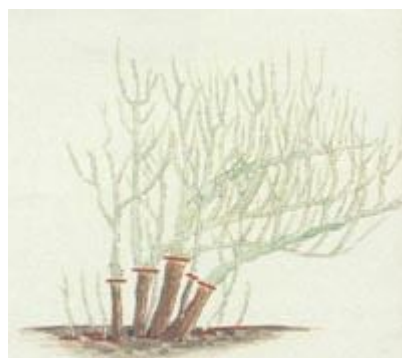
Potpuno orezivanje grma za podmlađivanje