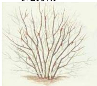
Orezivanje cvetajućih grmova