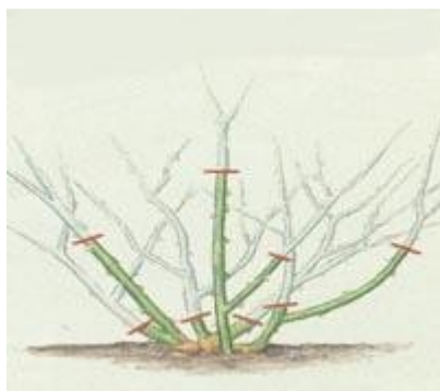
Orezivanje niskog cvetajućeg drveća