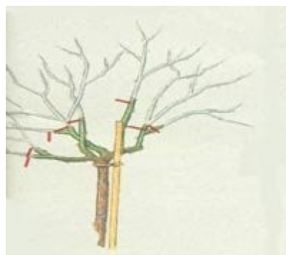
Orezivanje vrbe i ostalog drveća sa padajućim granama